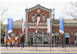
Het station in Dordrecht.

Na een heerlijke broodjeslunch genoten we van de tentoonstelling met werk van Jongkind & vrienden. Johan Jongkind (1819-1891) was een pionier van het impressionisme. Geboren in Nederland maar hij woonde het grootste deel van zijn leven in Frankrijk. Zijn rake observaties van de natuur en zijn losse manier van schilderen waren een 'eyeopener' voor de Franse schilders. Claude Monet zei dat Jongkind hem had leren kijken: 'Hij zorgde voor de opvoeding van mijn oog'. Na het bezoek was iedereen enthousiast over de kennismaking met het werk van Jongkind, Monet, Sisley, Boudin Daubigny, Pissaro en anderen. Een dag om met plezier op terug te kijken. De tentoonstelling is nog t/m 27 mei te bezoeken.